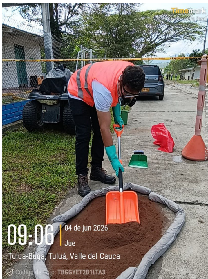
Simulacro derrame sustancias químicas